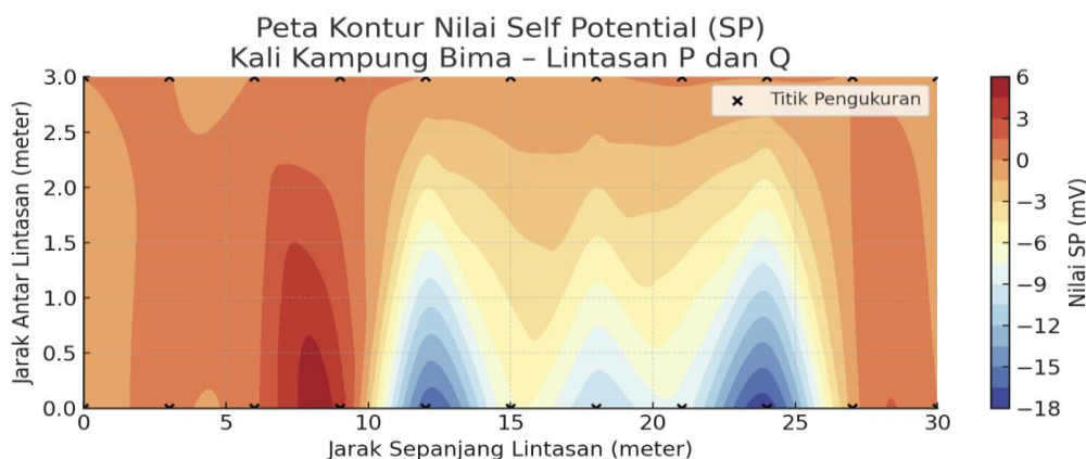
Gambar 4. Peta Kontur Isopotensial Nilai SP pada Lintasan P dan Q

Visualisasi kontur isopotensial memperlihatkan pola yang semakin jelas. Kontur yang rapat pada lintasan P, terutama di sekitar titik-titik anomali negatif, menunjukkan gradien potensial yang tinggi. Gradien ini menjadi indikator arah aliran lindi yang mengarah dari wilayah timbunan sampah menuju aliran Sungai [12]. Sementara itu, kontur pada lintasan Q lebih jarang dan terpola datar, menunjukkan kondisi tanah yang lebih stabil dan memiliki sedikit aliran fluida konduktif.