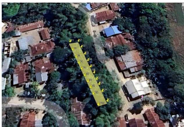
Gambar 1. Sebaran Titik Akuisisi Data

Penelitian dilakukan di Kali Kampung Bima, Kelurahan Kefa Selatan, Kabupaten TTU. Dua lintasan sejajar (P dan Q) dipetakan dengan jarak antar titik pengukuran 3 meter. Setiap lintasan terdiri dari 11 titik, sehingga total terdapat 22 titik pengamatan. Tahap pertama dalam penelitian ini adalah pembuatan desain survei untuk menentukan titik ukur, diikuti dengan kalibrasi alat, dan pengambilan data sesuai dengan peta desain survei seperti yang ditunjukkan pada Gambar 1. Peta desain survei dibuat menggunakan perangkat lunak ArcGIS 10.8