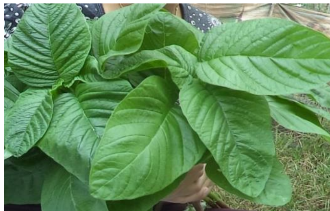
Gambar 3. Warna daun bayam hijau dengan umur tanaman 35 hari (dosis 1000 rads)

Hasil pengamatan di lapangan menunjukkan warna daun hijau. Tetapi tidak semua tanaman pada saat dipanen memiliki warna daun yang sama. Semakin besar dosis radiasi yang dipancarkan maka warna daun akan menjadi hijau kekuning-kuningan. Kloroplas atau mitokondria ternyata mengandung materi genetik yang juga dapat termutasi. Mutasi pada gen kloroplas akan menyebabkan kerusakan gen yang akan mengganggu proses fotosintesis pada daun. Perhatikan perbedaan warna daun pada gambar 3 dan 4 dibawah ini: