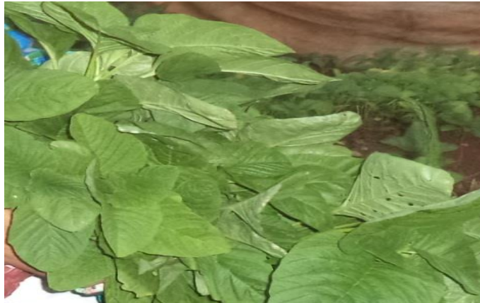
Gambar 4. Warna daun bayam hijau kekuning-kuningan umur 35 hari setelah panen (dosis 4000 rads)

Dari gambar 3 dan 4 terlihat perbedaan warna daun yang muncul dari hasil pemuliaan. Dalam pemeliharaan tanaman di lapangan hanya dilakukan penyiangan, pengairan atau penyiraman dan penyemprotan pestisida. Pemeliharaan tidak disertai pemupukan, dikarenakan supaya pada saat panen hasil pemuliaan yang diperoleh tidak dipengaruhi oleh unsur anorganik seperti pupuk. Seperti karakteristik lain besarnya energi radiasi multigamma yang dipancarkan tidak semuanya dapat diserap oleh benih dengan baik. Hal ini dapat mempengaruhi hasil produksi dan kualitas tanaman. Secara kuantitatif, juga terdapat perbedaan massa yang didapat untuk setiap perlakuan. Untuk membandingkan massa per 10 batang tanaman dengan perlakuan sesuai dosis yang diberikan dapat dilihat pada Tabel 2 dibawah ini: