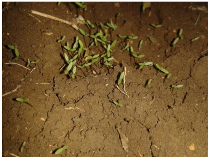
Gambar 1. Benih yang tumbuh hasil penyemaian

Efek genetik dari radiasi menyebabkan perubahan terhadap struktur dan komposisi pada kromosom. Keadaan ini menimbulkan bermacam bentuk mutasi pada keturunan tanaman yang sifatnya akan berbeda dengan tanaman induknya. Pengamatan dan pengambilan data terhadap pertumbuhan benih dilakukan serentak untuk semua perlakuan termasuk tanaman induk. Dalam pengamatan yang dilakukan ada 10 batang tanaman pada setiap sampel yang dijadikan sebagai patokan untuk pengukuran. Ini dilakukan agar memudahkan peneliti untuk menganalisis sifat fisis dari tanaman, dan juga memudahkan untuk melihat perbandingan varietas yang muncul antara sampel benih tanpa diradiasi dengan sampel benih yang telah diradiasi dengan dosis yang berbeda. Berikut ini merupakan gambar benih yang tumbuh dapat dilihat pada Gambar 1.